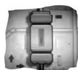
( ) Cilindro amarelo