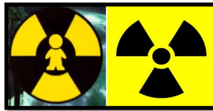
Figura 3: Imagem comparativa entre o símbolo da “criança tóxica” e o trifólio em a) ; e em b) resultado da pesquisa em atividade sobre o medo das fontes de energia.

Para a Feira de Ciências os alunos construíram e apresentaram maquetes das diversas usinas e puderem assim, renovar seus conceitos de segurança e viabilidade. Vigotski defende que é a partir de um desafio que a criança busca respostas para solucionar os problemas [8] e é desta forma que o ser humano desenvolve tecnologia – para solucionar um problema, para atender a uma necessidade emergente.