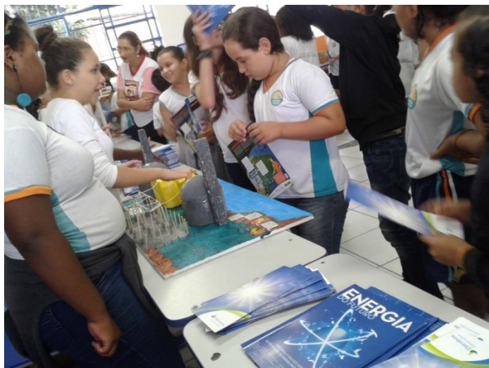
Figura 4: Apresentação de maquete das Usinas de Angra na Escola Municipal “Jacinta Enéas Orzil”.

Na Figura 4 observa-se a apresentação dos alunos na Feira de Ciências da maquete referente a usina termoeletrônica, neste momento foi possível verificar a efetividade na apropriação do conhecimento, quando os alunos descrevem cada componente da usina, e conseguem fazer comparações com os demais tipos de usina. Dessa forma, os alunos compreenderam que todos têm a contribuir e aprenderam a observar e valorizar os talentos de cada um, favorecendo a autonomia, construção de competência e estabelecendo vínculos através da busca da execução coletiva da Feira de Ciências. Neste sentido, todos os professores que participaram do projeto sinalizaram evolução dos alunos ao longo do projeto, maior interesse em pesquisa e curiosidade.