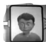
( ) Criança